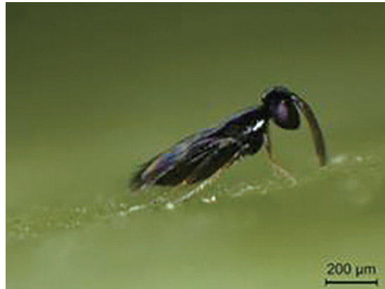
Female of Entedononecremnus sp.