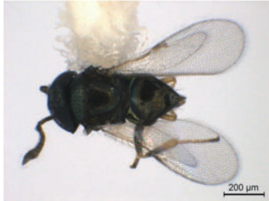
Female of Pseudleptomastix sp.