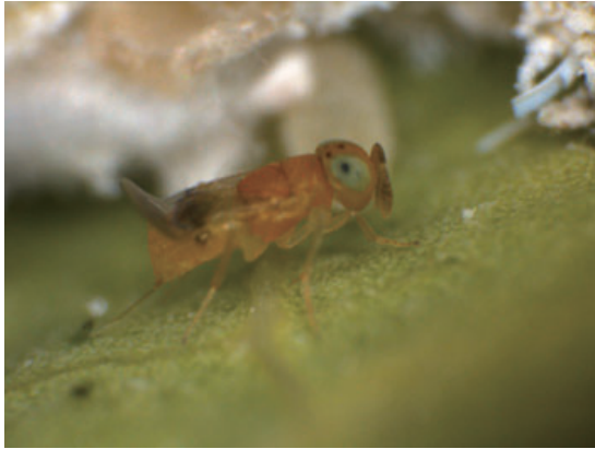
Female of Acerophagus papaya Noyes and Schauff