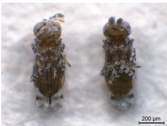
Female (left) and male (right) of Marietta leopardina Motschulsky

圖一、臺灣木瓜秀粉介殼蟲寄生蜂種類，包括木瓜抑蟲跳小蜂 ( Acerophagus papaya Noyes and Schauff)、 Pseudleptomastix sp.、 Entedononecremnus sp.、橫盾小蜂 ( Chartocerus walkeri Hayat) 及花翅跳小蜂 ( Marietta leopardina Motschulsky)