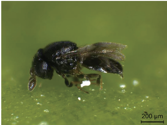
Female of Chartocerus walkeri Hayat